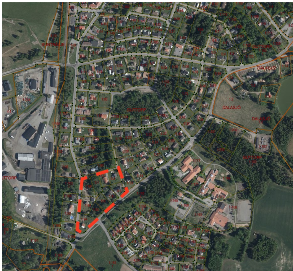
Figur 1. Område som omfattas av aktuell ändring.

Området som ändringen avser ligger i södra delen av Lundbrunn och avgränsas av Dalavägen i väst, Lundvägen i syd och sydväst, Furuvägen i öst och Stenåsgatan i norr. Aktuell planändring berör det område som benämns kvarteret Björken i gällande stadsplan. Totalt omfattar kvarteret cirka 17 000 kvadratmeter och består av 10 stycken bostadsfastigheter, varav fyra obebyggda och 6 bebyggda. Bebyggelsen utgörs av friliggande villor med tillhörande komplementbyggnader.