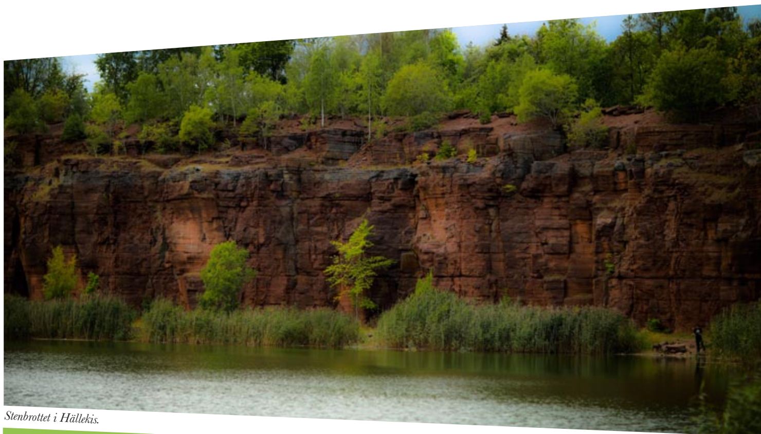
Stenbrottet i Hällekis.